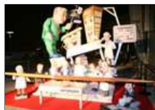
Ninot del médico de AP.